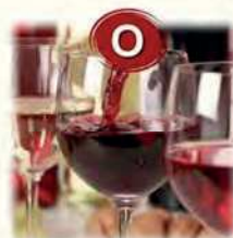
O Schwefeldioxid und Sulfite...