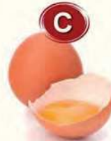
C Eier von Geflügel...