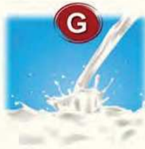
G Milch von Säugetieren...