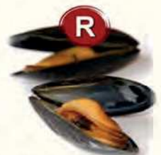
R Weichtiere... wie Schnecken, Muscheln, Tintenfische